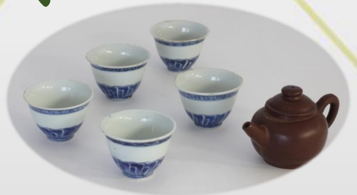
左 青花捻花文茗椀 右 紫泥茶銚 (禅文化歴史博物館所蔵)