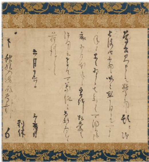
千利休書状 (禅文化歴史博物館所蔵)