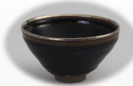
天目茶碗 (禅文化歴史博物館所蔵)