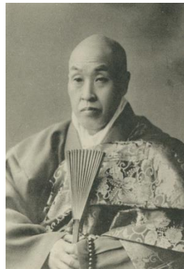
新井石禅

今回の書簡のように、個人の資料から駒澤大学の歴史に関連する事柄が発見されることは稀であり、大学内に残されている資料とは違った性格を持っていることから、大変意義の大きい発見です。ただ、書簡であることから、当事者同士での共有している事柄は記述されないため、明確な事実については難解な部分が多くあります。今後も、大学の内外を問わず、駒澤大学の歴史に関連する新たな資料の収集活動が求められます。