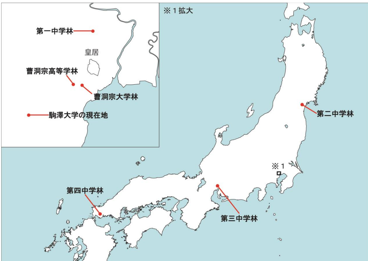
【図】各学林と駒澤大学の位置関係図

参考文献：世田谷学園中学・世田谷学園高等学校『創立百周年記念 校史 獅子児の伝統』2001年