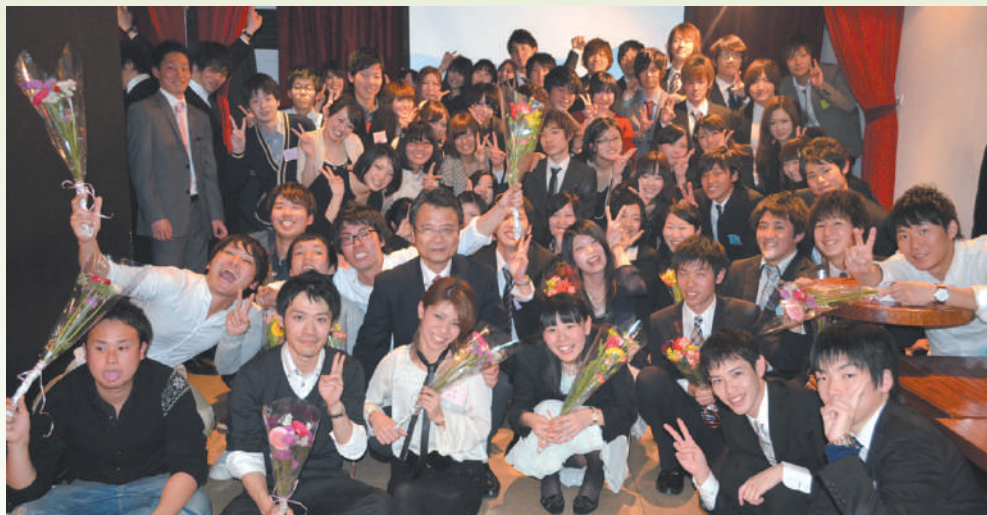
「4世代合同の追いコン」