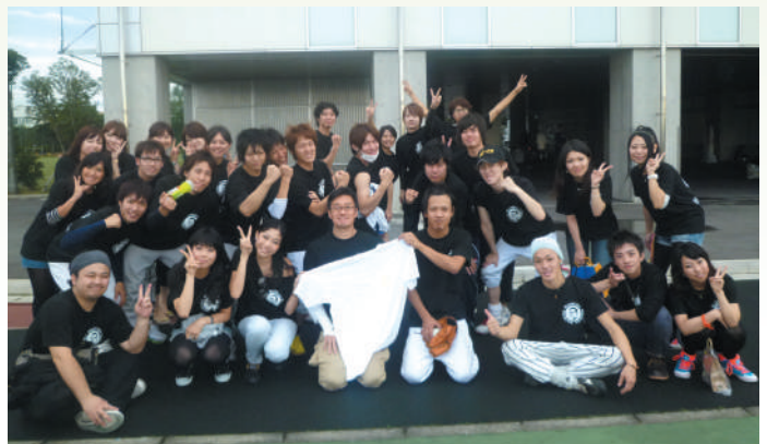
「ソフトボール大会」