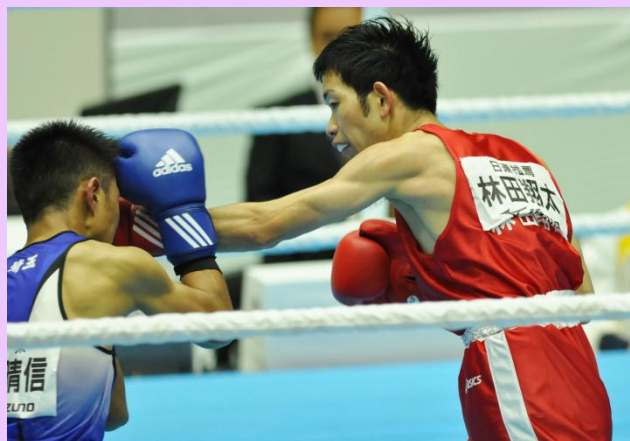
2014年11月22日 全日本ボクシング選手権大会（和歌山県）にて

(村野先輩から) 和歌山県では指導者を求められています。彼が和歌山に行けばいい感じになるのではないのでしょうか。オリンピックの方は、わたしとしてはまずリオに行って貰いたい。彼にとってとても狙い目だと思います。