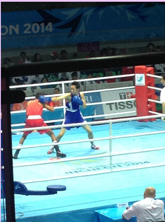
2014年9月27日 仁川アジア競技大会（韓国）にて