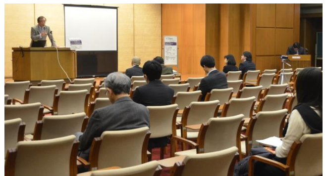
(第 6 回 F D 研修会の様子)