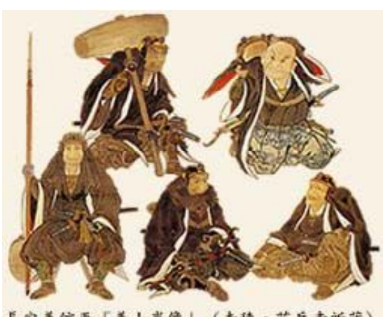
長安義信画「義士肖像」(赤穂・花岳寺所蔵)