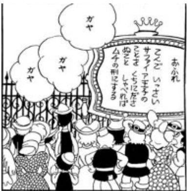
「手書き文字」 縦書き