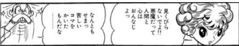
〔魔女の娘へケート〕

夜空に舞い上がる鳥の群れ、光りの帯に導かれ、 天空へ天空へと羽ばたきをはじめています。この鳥 はメッセージを伝える鳥「はと【鳩】」かと思われ ます。この次に聯想づけに順って手書き手紙文字の 齧が描かれていきます。